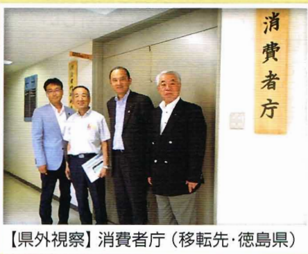
【県外視察】消費者庁（移転先・徳島県）