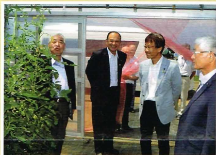
【県内視察】総合農業技術センター