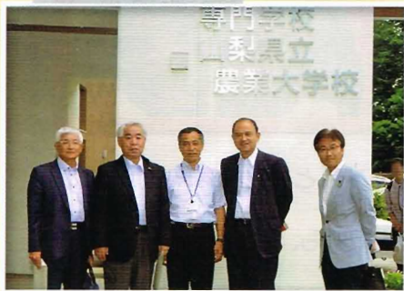
【県内視察】県立農業大学校