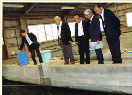
【県内視察】水産技術センター