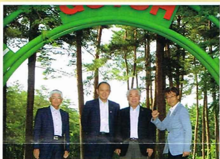
【県内視察】山梨県馬術競技場