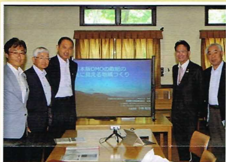
【県内視察】丘の公園会議室（清里の現状と課題）